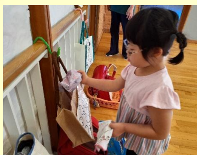
身支度も大事な学びです

放課後等デイサービスでは、子どもたちが安心して過ごしなが、運動や創作活動、季節の行事など、さまざまな体験を通して成長できるよう支援しています。上半期は、普段の活動に加えて、子どもたちは夏休み外出や行事などに楽しく取り組み、笑顔いっぱいの時間を過ごしました。その様子をご紹介します。