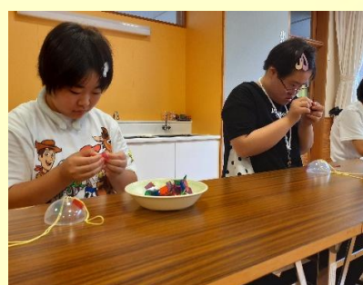
真剣なまなざしで製作中