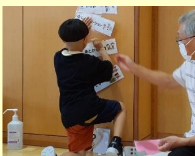
今日は、僕がお当番♪