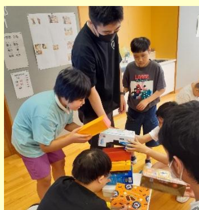
力をあわせて ドキドキチャレンジ！