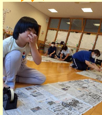
新聞ドーム製作中✂