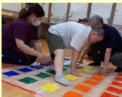
バランスをとりながら 頑張っています