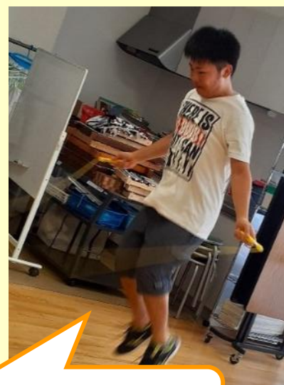
ついにできちゃった！ 二重跳び！！